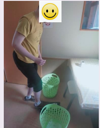
👉 利用者さんペットボトルを潰し作業中