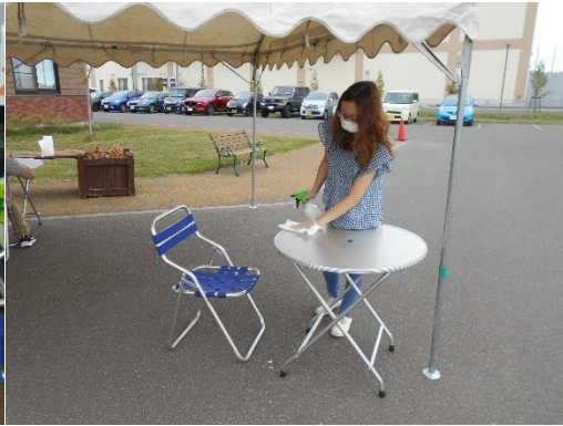
<使用後も迅速な消毒>