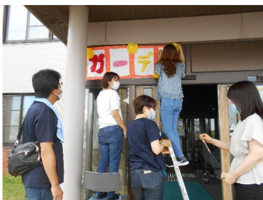
<ガーデンパーティ装飾中>