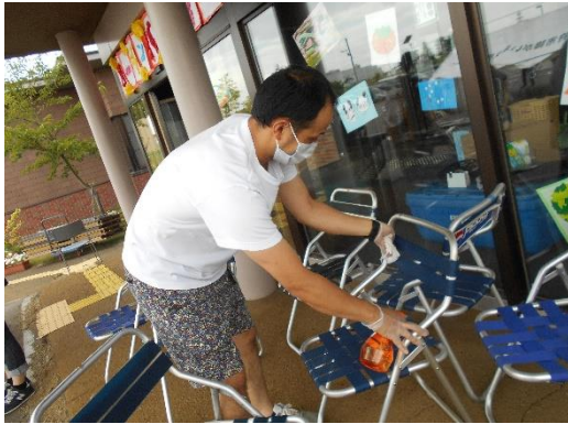
<使用前に消毒の徹底>