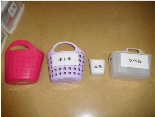
それぞれのカゴに入れる物を文字で提示

今回ご紹介するのは、とある利用者さんの新たに導入する作業についてです。今までは紙とビニールの仕分けをしていた方ですが、長期にわたって実施しているためか、マンネリ化してしまったため、新たにペットボトル仕分けの導入を計画しています。その道具作りの際に、その利用者の特性に合わせて、文字による提示をするほかにも、今回初めてのペットボトル仕分けであるため、難しい場面もあると考え、「てつだってください」カードを導入することで、職員への手助けを要求できるようにしました。