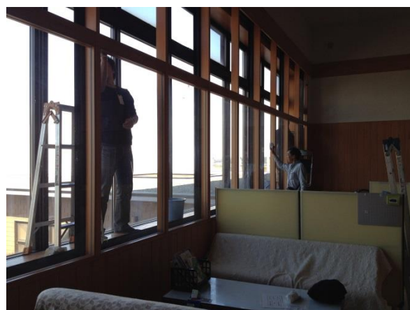
こんな機会であればほんとうにできない体育館の窓清掃。窓の間に入って清掃していただきました。