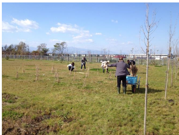
5年後にはたわわに実るハスカップの畑の冬囲い。

そんな中から、10月18日に行われた環境整備の様子をお伝えしたいと思います。普段なかなかできない外回りの清掃、窓枠の中や外窓の清掃など、気になってはいたけれど手を付けられないでいたところの清掃をお父さんお母さんの協力でやっていただきました！！