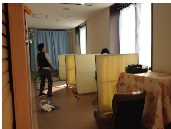
利用者の活動スペースなども隅々まできれいに していただきました。