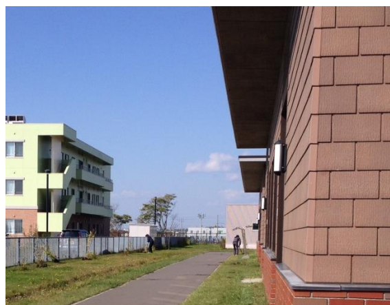
毎年除雪で折れてしまっても花を咲かせる木槿。 念願の植え替えが出来ました！