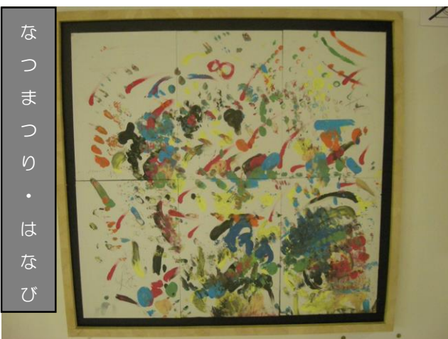
なつまつり・はなび