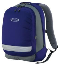
リュックやレッスンバック

※揃えるものがたくさんあり大変かと思います。初回の療育日に間に合わない場合はご相談ください。すぐには使わないものもあります。