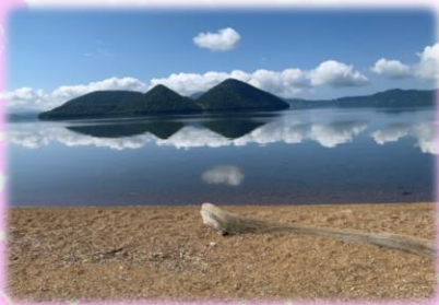
(名乗ることが憚られる職員O)

夜勤が主な勤務なので体調やリズムを崩さないようにと毎年神社で祈願している自分ですが今年も大きな事故なく新年迎えられそうで良かったです。