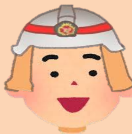
はまなす園防災キャラクター