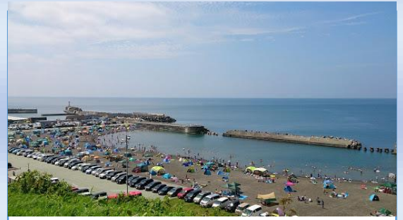
昨年？の厚田海浜プール

つまらない影響ばかりの昨今ですが、早く今まで以上に自由に遊んだり、安全に出かけられるような、楽しい世界に進化していきたいものですね。