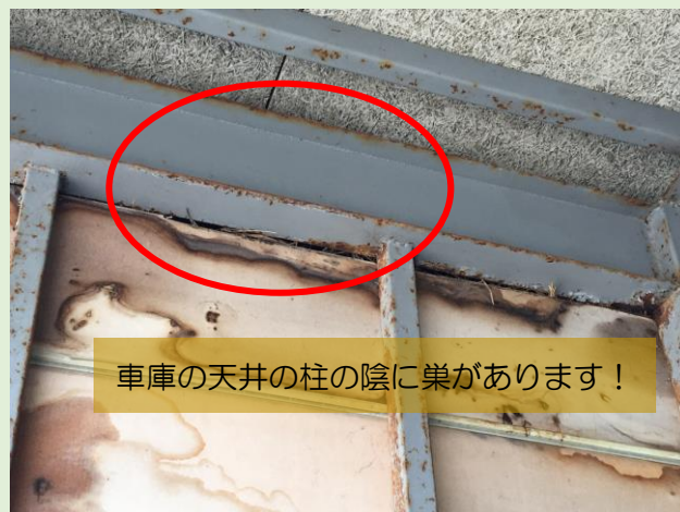
車庫の天井の柱の陰に巣があります！