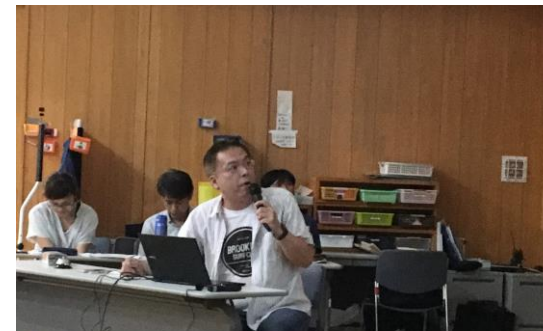
園の木村職員も人権委員として研修の企画にたずさわっています。