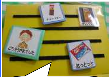
パッケージの写真カード